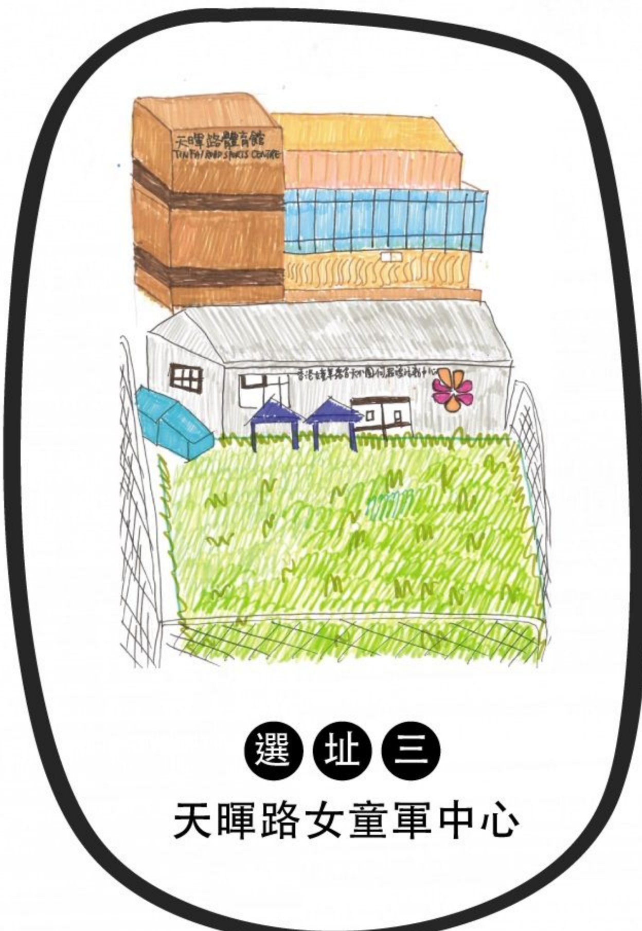
選址三 天暉路女童軍中心

透過多年來各部門、團體及街坊之間的討論及爭取，現時天水圍興建公營街市的可行選址，包括以下四個：