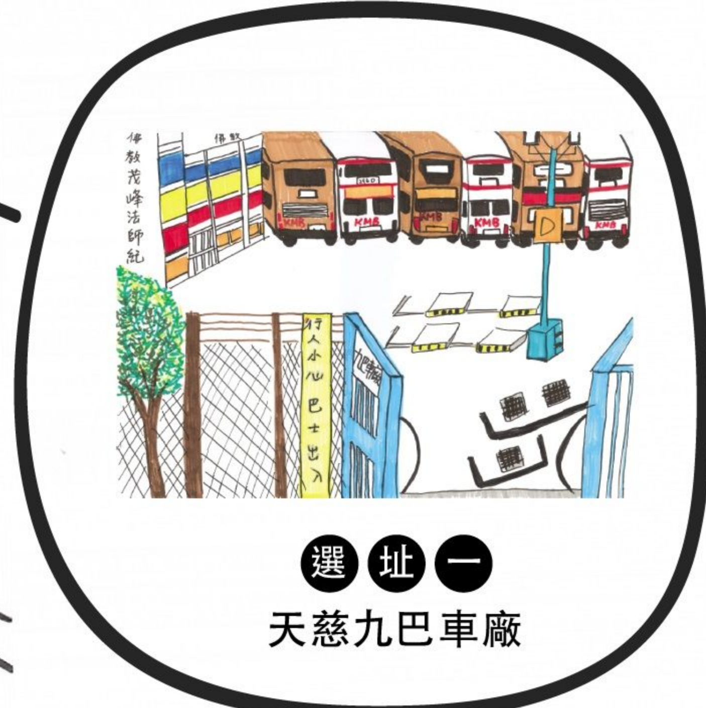
選址一 天慈九巴車廠