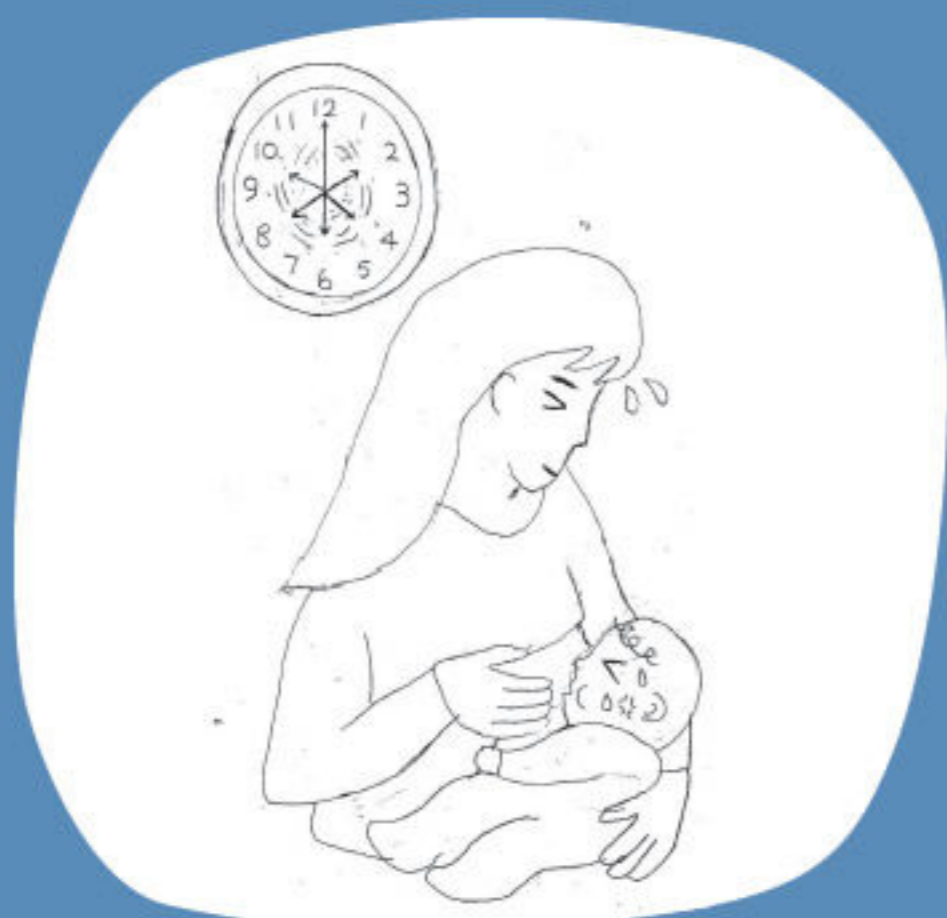
每兩小時餵一次奶，嬰兒含乳困難，容易咬損乳頭