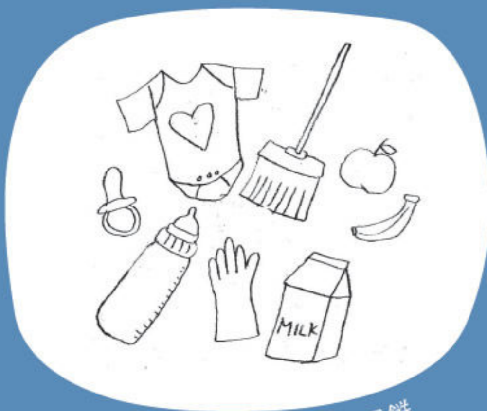
清潔寶寶用品，做家務，買餵