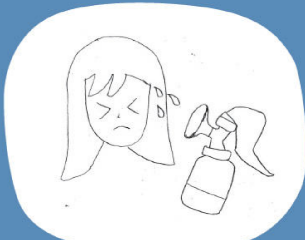
谷奶漲痛，出奶困難，需要泵奶