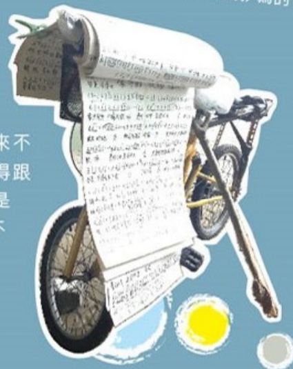
單車上掛著半個人身高長的歌譜，都是媽媽抄寫的

媽媽是東莞人，出生於文革以前。「那時候上山下鄉，被派去鄉下務農，時值反叛期，喜歡與廣州仔結伴唱台灣情歌。」媽媽老早就開始唱歌。「那時候電影院外會賣兩分錢的歌譜，都是革命電影的插曲、主題曲。我看著那些歌譜，看著看著就看懂了，完全是無師自通。」時至今天，她依然清楚記得第一首她教同學看歌譜唱的歌叫《讓我們蕩起雙槳》，那時他們都是小學三年級的孩子。從孩提開始一直唱歌，「26歲落來香港結婚生育後就無唱了，忙家務嘛。」