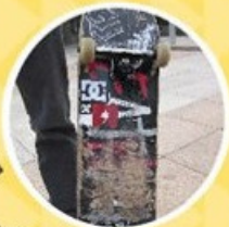
滑板底部傷痕累累，滿佈他奶刻苦練習的戰績！

與他奶及滑板場上其他「板仔」傾談過後，原來滑板場的設計應有高台、斜台、矮欄等，供板仔板女練習花式。