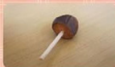
製作簡易的荔枝核陀螺

我問爸爸小時候有甚麼玩，他說吃完荔枝後，會把荔枝核洗淨切半，再在核的中央插入半枝牙籤，便成了一個簡單的陀螺。以前家裡沒甚麼玩具，自製陀螺也很普遍。下次吃完荔枝和小朋友一起比賽誰的可陀螺可以轉得最久吧！