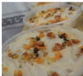
有機蘿蔔糕 $88 / 一底