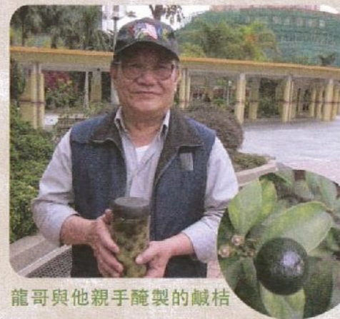
龍哥與他親手醃製的鹹桔

天水圍有一處空地，當走近去看時，會發現種滿青色的桔仔，除了桔仔，還有柚子、蒜頭、蘭花等，小小的花園令人驚喜。龍哥就是開墾這個小花園的人，每隔兩三天，他便會到花園澆水堆肥。龍哥曾經當兵，做廚師、工程師，現在是天水圍區一名街坊。退休後，龍哥開始自己種植桔仔或其他植物，日子非常寫意。